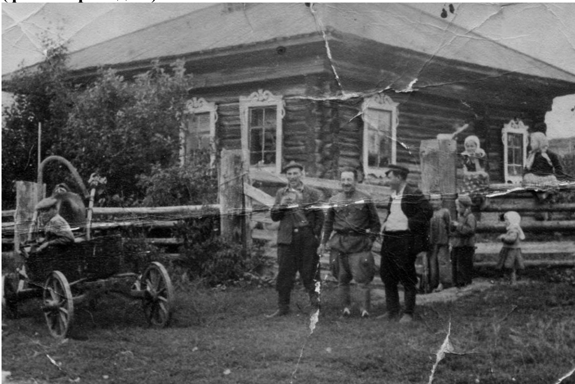
(фото «Мой дом»).

Это мой родной дом (в Путанском крае), где я родилась и выросла. Взрослые ведут свои разговоры, а мы ребяташки – свои.